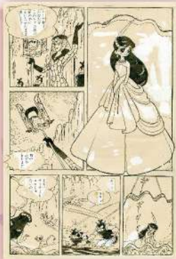
手塚治虫「エンゼルの丘」 ©手塚プロダクション

本展を通じて、トキワ荘のマンガ家たちの新たな魅力を知っていただければと思います。