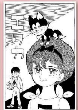
山内ジョージ「エリカ」 ©山内ジョージ