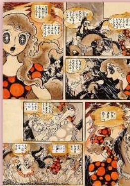
水野英子「銀の花びら」 ©水野英子