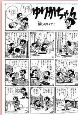
藤子・F・不二雄「ゆりかちゃん」 ©藤子プロ