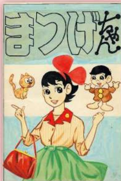
赤塚不二夫「まつげちゃん」 ©赤塚不二夫