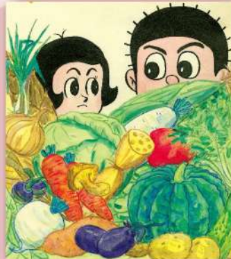
寺田ヒロオ「にらめっこ」 ©寺田ヒロオ