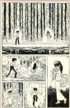
石ノ森章太郎「龍神沼」 ©石森プロ