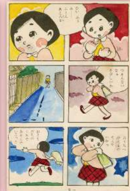
森安なおや「お母さん」 ©森安なおや