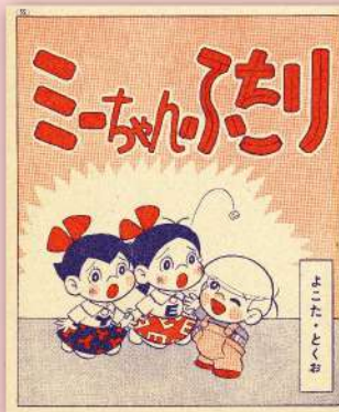
よこたとくお「ミーちゃんふたり」 ©よこたとくお